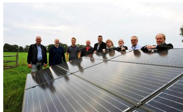
Energieke Buurtschappen W'wijk (2x)