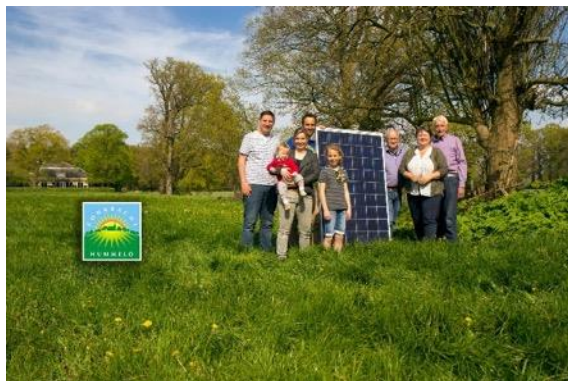
Zonkracht Hummelo (3x)