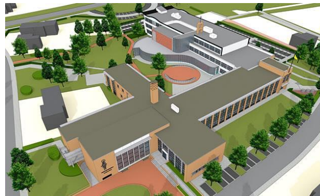
Groenkracht Groenlo Marianum