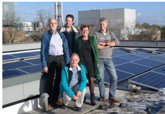
Duurzame Energie Eibergen(3x)