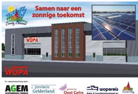
Kei Zonnig Lichtenvoorde