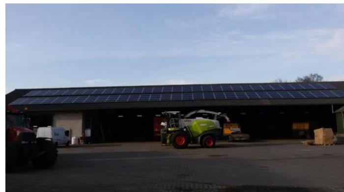
Noaberzon Vragender (2x)