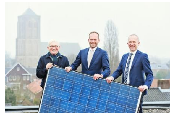
Diemse Zon (2x)