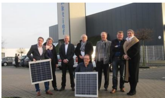
Groenkracht Groenlo (2x)